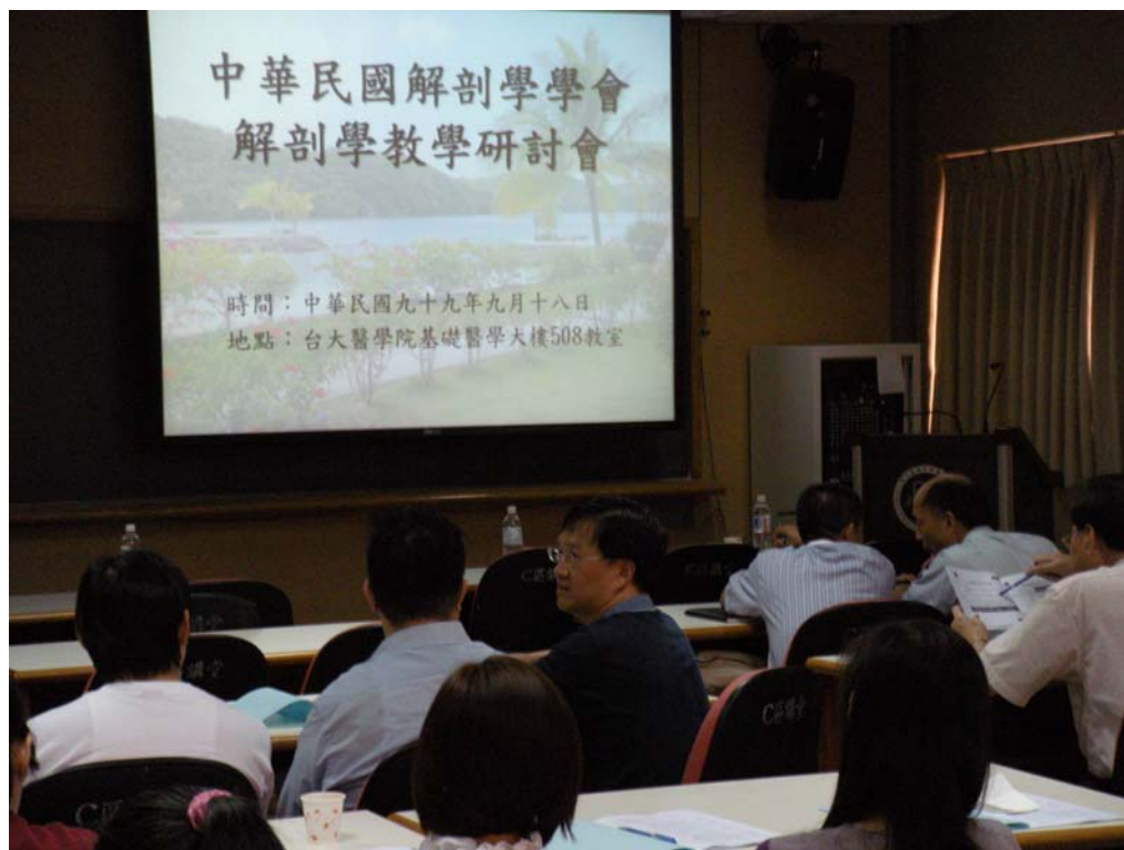
報到後會前意見溝通