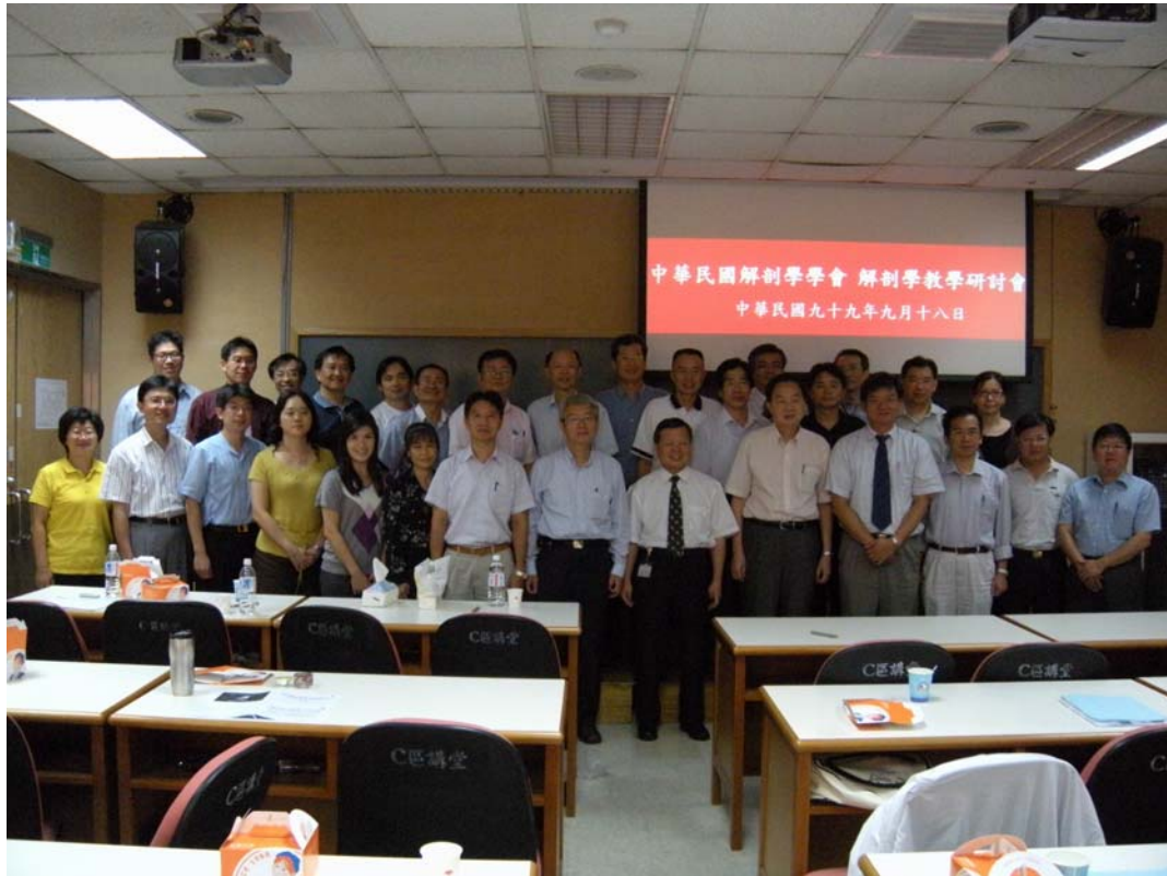
教學研討會會員大合影